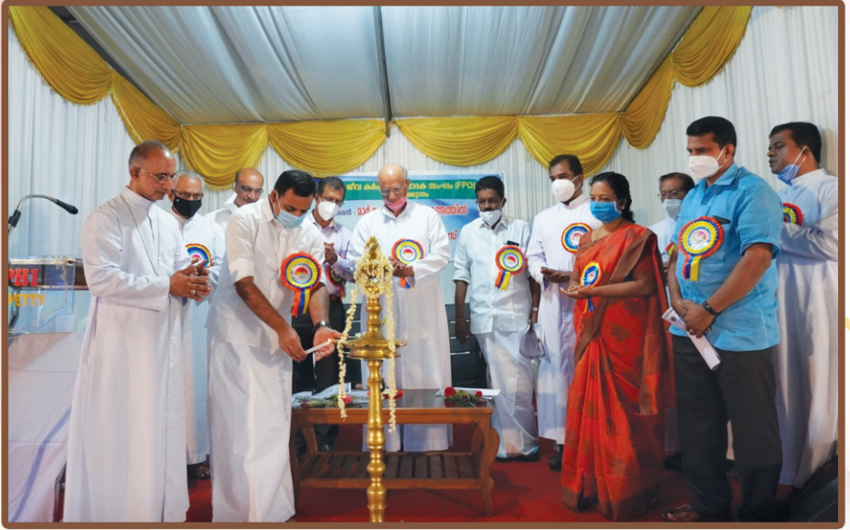
കാരക്കുന്നം തുടവകയിൽ ആരംഭിച്ചിരിക്കുന്ന ജീവ കർഷക ഉല്പാദക സംഘത്തിന്റെ (FPO) ഉദ്ഘാടനം.