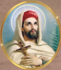
St. John Britto 04