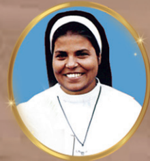
Bl. Rani Maria 25