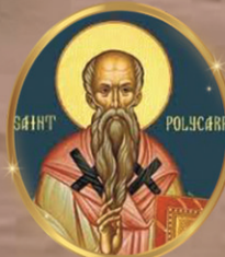
St. Polycarp 23