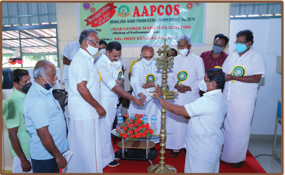
കർഷക സംഘത്തിന്റെ ആഭിമുഖ്യത്തിൽ ആരക്കുഴയിൽ പ്രവർത്തനം ആരംഭിച്ച ആരക്കുഴ അഗ്രി പ്രൊഡ്യൂസേഴ്സ് കോ-ഓപ്പറേറ്റീവ് സൊസൈറ്റിയുടെ (AAPCOS) ഉദ്ഘാടനം