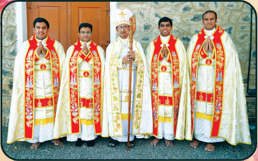
NEWLY ORDAINED PRIESTS OF THE EPARCHY WITH THE BISHOP