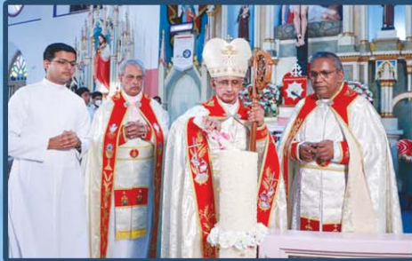
സെന്റ് ജോസഫ് ഫൊറോന ചർച്ച്, മാറിക