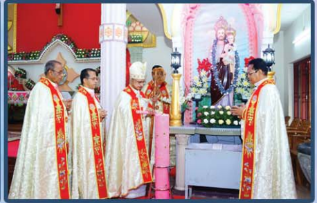
സെന്റ് ജോസഫ് ചർച്ച്, പെരിങ്ങഴ