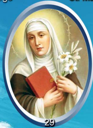
St. Catherine of Siena