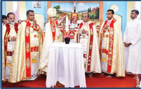
സെന്റ് ജോസഫ് ചർച്ച്, നെല്ലിമറ്റം