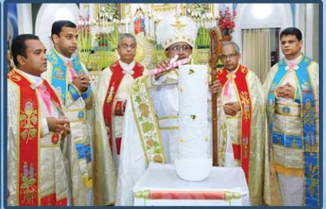
ഹോളി ഫാമിലി ചർച്ച്, ബസ്സഹം