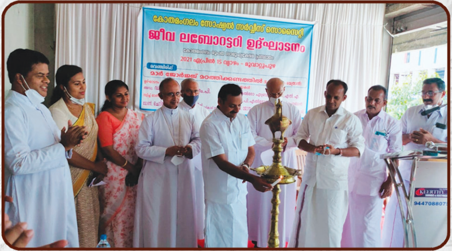
മൂവാറ്റുപുഴയിൽ ആരംഭിച്ചിരിക്കുന്ന ജീവ ലബോറട്ടറിയുടെ ഉദ്ഘാടനം