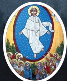
The Ascension of Jesus Christ