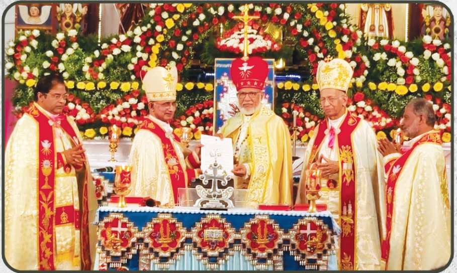
മേജർ ആർക്കി എപ്പിസ്കോപ്പൽ തീർത്ഥാടനകേന്ദ്രമായി പ്രഖ്യാപിച്ച ആരക്കുഴ ദൈവാലയം