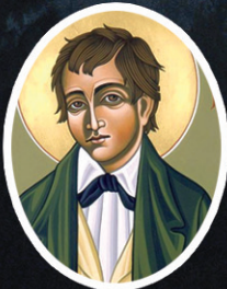
St. Dominic Savio