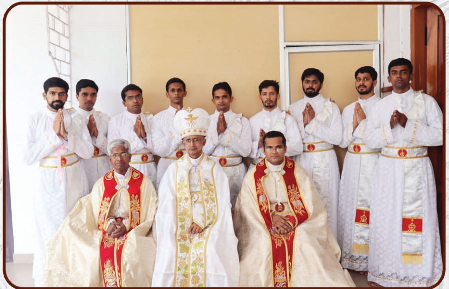
ബഹു. ഡീക്കനാർക്ക് ആശംസകൾ